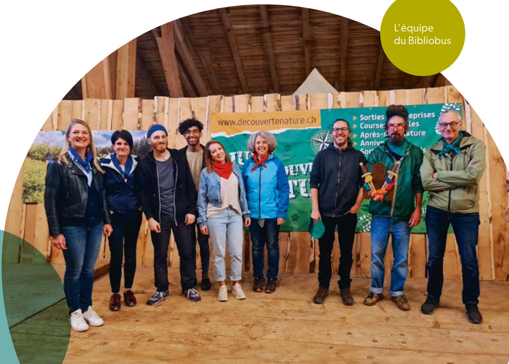
L'équipe du Bibliobus

Les comptes, le bilan et le rapport de révision figurent à la fin du présent rapport.