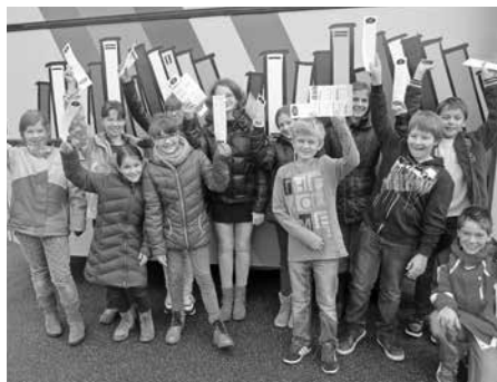
Une classe de l'école primaire de Courchapoix.

Afin de promouvoir notre service de visites de classe, une nouvelle rubrique a été créée sur notre site internet. Un dépliant est également à disposition des enseignants. Au total, nous avons présenté le Bibliobus et son fonctionnement à 22 classes en 2014.